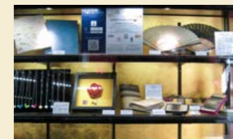
伝統工芸品展示(エントランス)

400年の歴史を誇り、国内シェア99% を占める金沢の金箔。1号車エント ランス客室側壁面、伝統工芸展示棚壁面 は、金沢の代表的な金箔メーカーであ る「箔一」の施工により金沢金箔の装 飾が施されています。