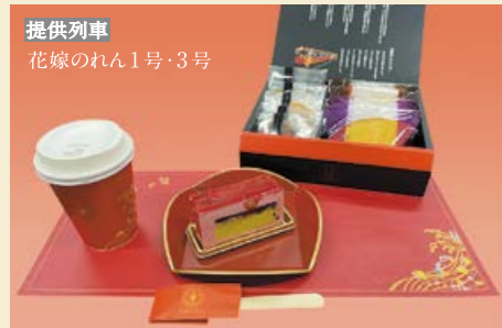
提供列車 花嫁のれん1号・3号

スイーツセット 要予約 (税込)¥2,000 和軽食セット 要予約 (税込)¥2,500 ほろよいセット 要予約 (税込)¥2,000