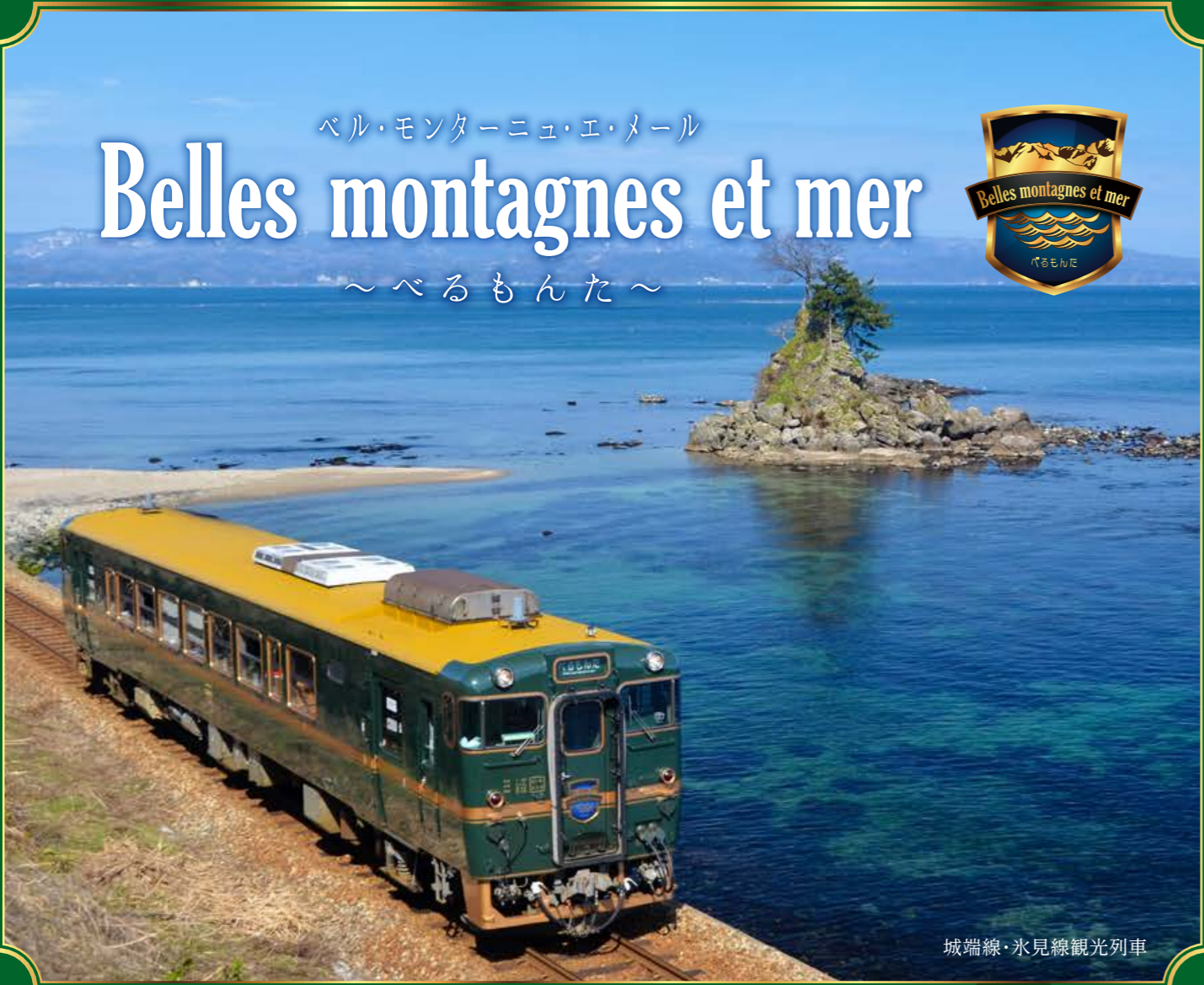
城端線・氷見線観光列車