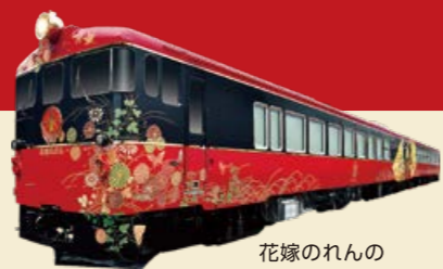
花嫁のれんの 詳しい情報はこちら ▶▶▶