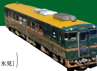
べるもんたの 詳しい情報はこちら ▶▶▶