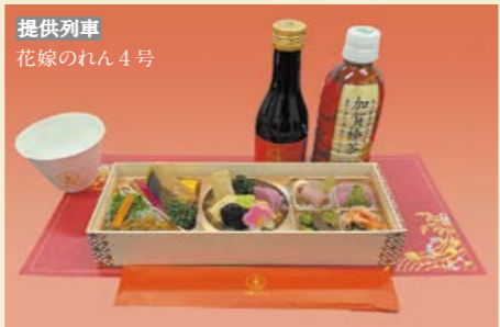
提供列車 花嫁のれん4号

世界的に活躍するパティシエ辻口博啓氏の「ル・ミュゼ・ドゥ・アッシュ」オリジナルセレクトスイーツ