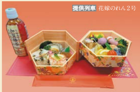
提供列車 花嫁のれん2号